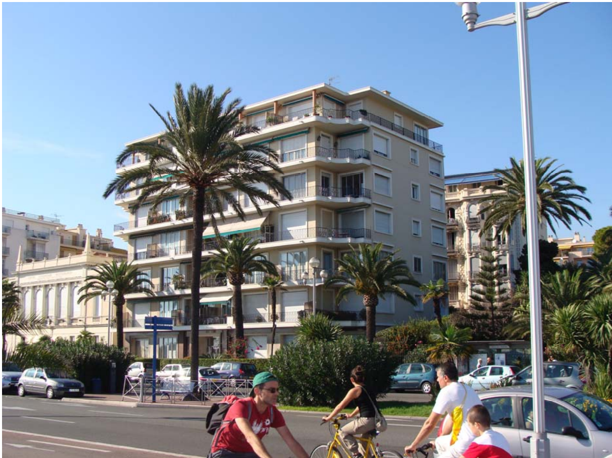
Gloria Mansions IV, 63, promenade des Anglais, Nice. Januar 2010. Gloria Mansions I, befindet sich hinter dem neuen Gebäude rechts.

Hirschfelds Wohngebäude sei durch das dort befindliche moderne Gebäude ersetzt worden. Wir stellten jedoch schnell fest, dass dieses Gebäude als Gloria Mansions IV bezeichnet wird. Auf der Rückseite des Gebäudes wurde klar, dass die Gloria Mansions einen Komplex von Gebäuden darstellen, die zu unterschiedlichen Zeitpunkten errichtet wurden. Die ursprünglichen Gloria Mansions I (1924), die von Dalmas entworfen wurden, waren nach wie vor vorhanden. Gloria Mansions II, die gelegentlich auch als „der Anbau“ bezeichnet werden, entstanden etwas später nebenan (123, rue de France). Es handelt sich dabei um ein einfaches, kleines, dreistöckiges Gebäude, das dem von Dalmas hochgeschätzten Stil des französischen 18. Jahrhunderts nachempfunden war. 13 Gloria