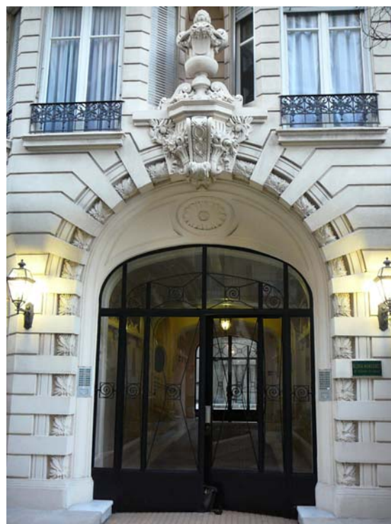
Südeingang von Gloria Mansions I. Oktober 2009.

Geschäftsmann, heiratete. 15 Es war Fontanas Idee, Gloria Mansions IV 1952 (nach Plänen der Architekten Milon de Peillon und René Livieri) im Garten vor dem Gebäude Hirschfelds und an der Adresse 63, promenade des Anglais zu errichten.