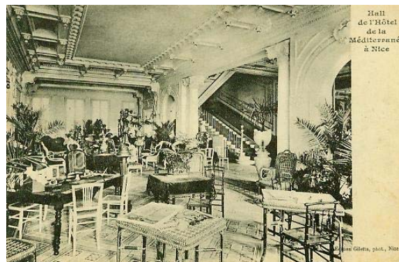
Eingangshalle des Hôtel de la Méditerranée. Postkarte ca. 1909.

Das Hôtel de la Méditerranée war ein großes, wenn auch nicht das beste Hotel in Nizza. Diese Rolle fiel eher dem an derselben Straße gelegenen Hôtel Negresco (37, promenade de Anglais) oder dem Hôtel Ruhl (1, promenade de Anglais) zu. 4