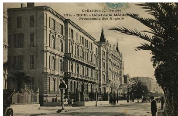
Hôtel de la Méditerranée, 25, promenade des Anglais, Nice. Postkarte ca. 1915, Sammlung Hans Soetaert.

Das Hôtel de la Méditerranée war ein großes, wenn auch nicht das beste Hotel in Nizza. Diese Rolle fiel eher dem an derselben Straße gelegenen Hôtel Negresco (37, promenade de Anglais) oder dem Hôtel Ruhl (1, promenade de Anglais) zu. 4