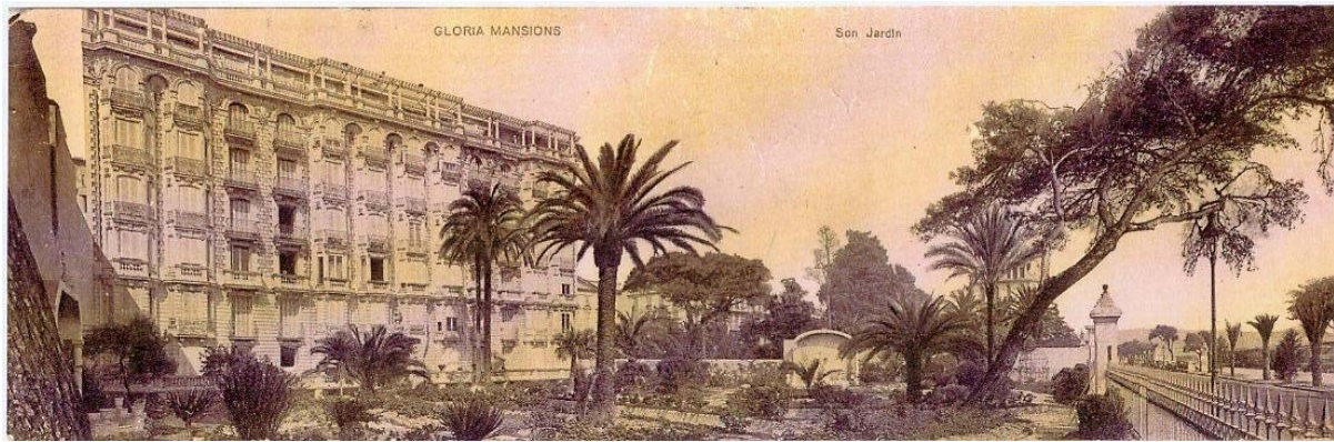
Gloria Mansions I, mit dem Garten, 63, promenade des Anglais, ca. 1930.

setzungen als langfristige Unterkunft. 8 Das Gebäude zeichnete sich durch Stil und Komfort aus und lag in unmittelbarer Nähe zu seiner vorherigen Unterkunft im Hôtel de la Méditerranée. Das sechsstöckige Gebäude war 1924 von dem Architekten Charles Dalmas (1865–1938) 9 erbaut worden und verfügte auf jedem Stockwerk über vier Appartements. Jedes Appartement hatte eine Wohnfläche von ungefähr 130 m 2 , verfügte über drei große Fenster auf der Vorderseite und einen Balkon. 10