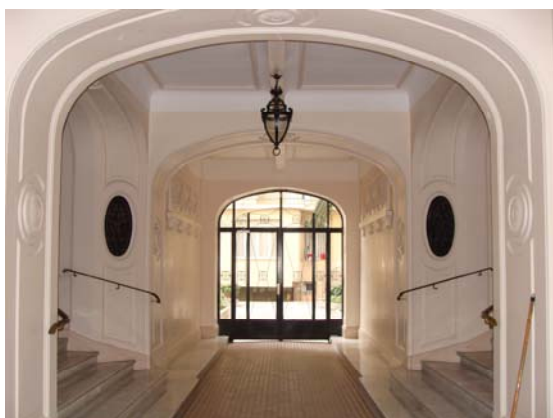
Gloria Mansions I, Eingang, January 2010.

nicht mehr weiterverfolgt (Thévenon 2003: 76). Es ist ein großes Wohngebäude aus Stahlbeton mit einer unterirdischen Garage, Läden im Erdgeschoss und fünf Wohnetagen. Das Art-Deco-Design, das ägyptische Motive auf der Außenfassade und Mosaiken und Buntglas im Inneren aufweist, gilt als eines der gelungensten Projekte seiner Art in Nizza. Gloria Mansions III wurden 1989 in l'Inventaire supplémentaire des Monuments historiques aufgenommen (Bilas/Rosso 2007: 110-114).