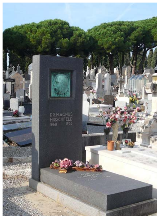
Hirschfelds Grab, Cimetière de Caucade, Nice, Oktober 2009.