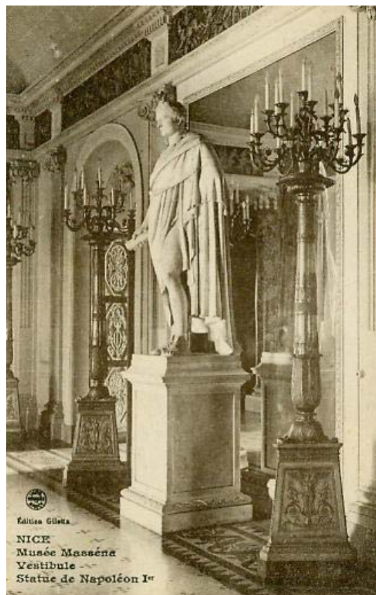
Die Statue Napoleons im Vestibül des Museums Masséna, Nice, Postkarte ca. 1910

arbeitete damals als Redaktionsassistent bei Bompiani Editore in Mailand. 25 Der