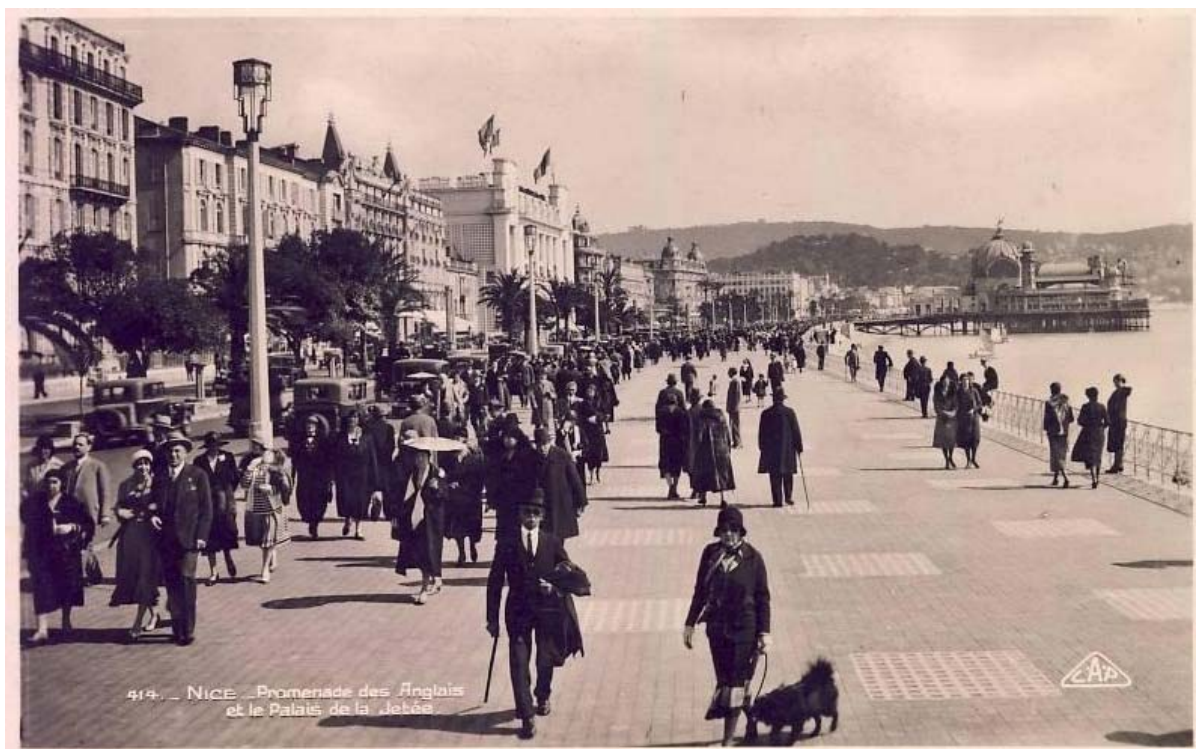
Die promenade des Anglais, Nice, links: das Hôtel de la Méditerranée. Postkarte 1932.

Jahre lang immer wieder hier aufgehalten (Clement 1993: 6-7). 5